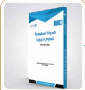
إعداد د. غيثان بن صالح العمري

خلصت النتائج إلى ثلاث حزم مترابطة من التحديات: (١) تحديات الطرق وأبرزها ضعف وضوح/كفاية الإشارات المرورية البصرية في بعض المواقع وما يصاحبه من مشكلات كالإضاءة غير الكافية في بعض الطرق والعوائق التي تُضعف الرؤية، وهو ما يرفع العبء على السائق الأصم لأنه لا يمتلك "بديلًا سمعيًا" يعوّض نقص الدلالة البصرية. (٢) تحديات بشرية تشمل نقص المعرفة/الالتزام بأنظمة المرور، والانشغال بالهاتف، وضعف الإلمام بميكانيكا المركبات والصيانة، لكن الأكثر حساسية كان حاجز التواصل مع الجهات المعنية (كالمرور وشركات التأمين ونحوها) إضافة إلى ضعف مراعاة بعض السائقين الآخرين لاحتياجات الضعف السمع على الطريق. (٣) تحديات مرتبطة بالمركبة تتمثل في غياب/ضعف إشارات الإنذار المرئية لبعض المؤشرات الحيوية (كالوقود والزيت وحرارة المحرك...)، مع ملاحظة أن امتلاك بعض المشاركين لمركبات أحدث خفف جانبًا من هذه التحديات. وبناءً على ذلك أوصت الدراسة بحزمة حلول "متكاملة" تجمع بين: تطوير الإشارات المرورية البصرية وتحسين إضاءة الطرق، وتجهيز المركبات بأنظمة إنذار مرئية وإضاءة أفضل ودعم إدراك بصري أشمل (مثل كاميرات/مرايا/تنبيهات اهتزازية)، إلى جانب التدريب والتوعية عبر مواد مرئية/مترجمة بلغة الإشارة ودعم تقديم الخدمة بلغة الإشارة في الجهات ذات العلاقة لتقليل فجوة التواصل وقت الحوادث والإجراءات.